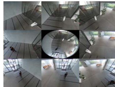
九分割畫面由一個360°全景視窗及八個其他區域影像視窗所組成，使影像監看無死角